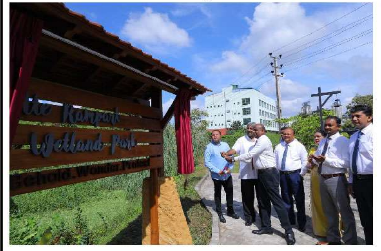
කුමන ආණ්ඩුවක් බලයට පත්වුවද ජනතාවට හිතකර ව්‍යාපෘති අඛණ්ඩව ඉදිරියට ක්‍රියාත්මක කළ යුතු බව නාගරික සංවර්ධන හා නිවාස අමාත්‍ය ප්‍රසන්න රණතුංග මහතා පසුගිය දා පැවසීය.

ලෝක නගර දින දා කෝට්ටේ කොටු බැම්ම හෙළ බිම් උද්‍යානය ජනතා අයිතියට